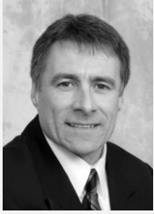
Hon. Allister Surette C.E.N.É Président Nouvelle-Écosse